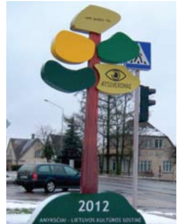
2012 metais Anykščiams tapus Lietuvos kultūros sostine, mieste buvo įrengti apie šį titulą bylojantys ženklai, bet jų jau seniai nebelikę.

„Labai liūdna, kai skiriami mokesčių mokėtojų pinigai skirtam seminarui dėl pasirengimo tapti kultūros sostine, kur buvo naudojamos lėšos: patalpų nuomai, maistui, renginio reprezentacijai, savivaldybės darbuotojų užmokesčiui. Rengiamas toks renginys, skiriamos savivaldybės lėšos be jokio aiškaus plano. Vėliau