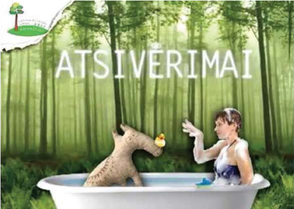
Pirmąjį „Anykščiai – Lietuvos kultūros sostinė“ projektą reklamavo vonioje sėdintys žymūs anykšėnai.

Kultūros ministerija paskelbė, kad 2026-aisiais Lietuvos kultūros sostinė bus Kėdainiai, 2027-aisiais – Pasvalys, o 2028-aisiais – Zarasai. Skelbiama, kad šio titulo siekė septynios Lietuvos savivaldybės, tačiau Anykščių tarp jų nebuvo.